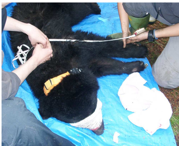
図2：ツキノワグマの生態研究（外部計測と発信器の装着）