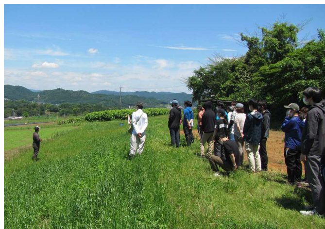
図3：被害を受けている農地における学生実習